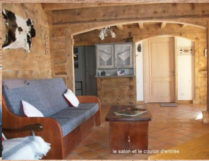
le salon et le couloir d'entrée