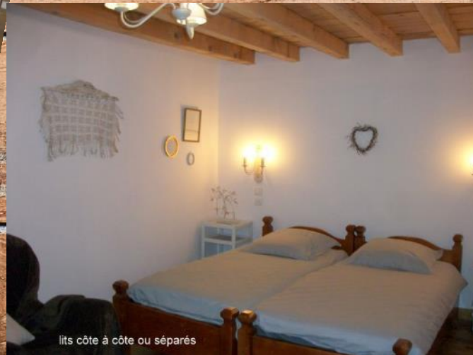
lits côte à côte ou séparés