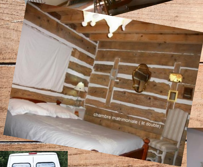
chambre matrimoniale ( lit double)