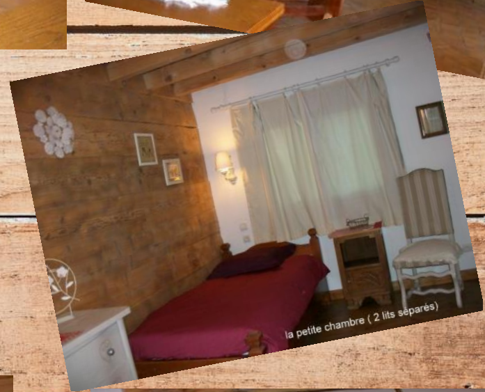
la petite chambre ( 2 lits séparés)